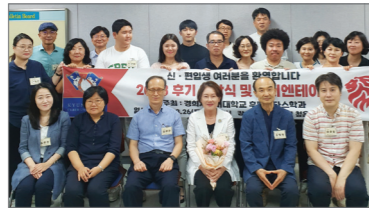
입학식 및 오리엔테이션