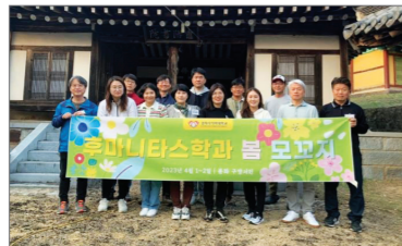
후마니타스학과 봄 모꼬지