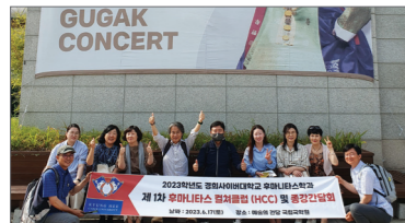
특성화프로그램 후마니타스 걸쳐클럽